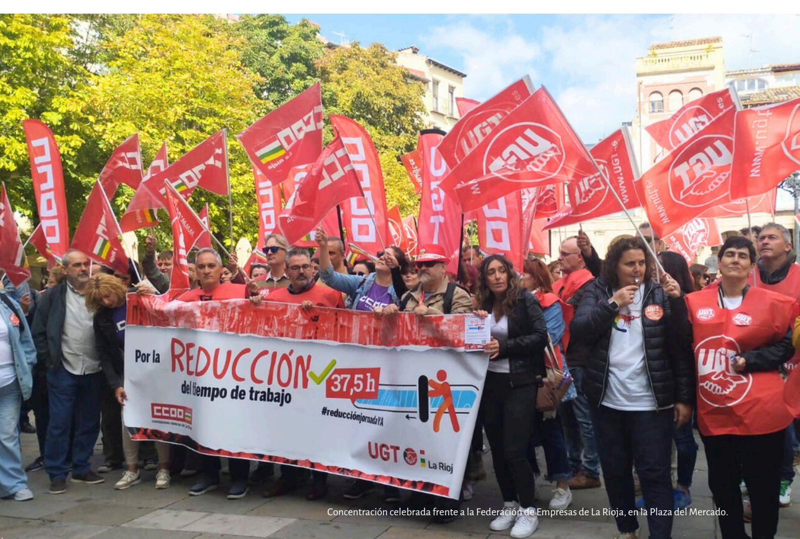
Concentración celebrada frente a la Federación de Empresas de La Rioja, en la Plaza del Mercado.