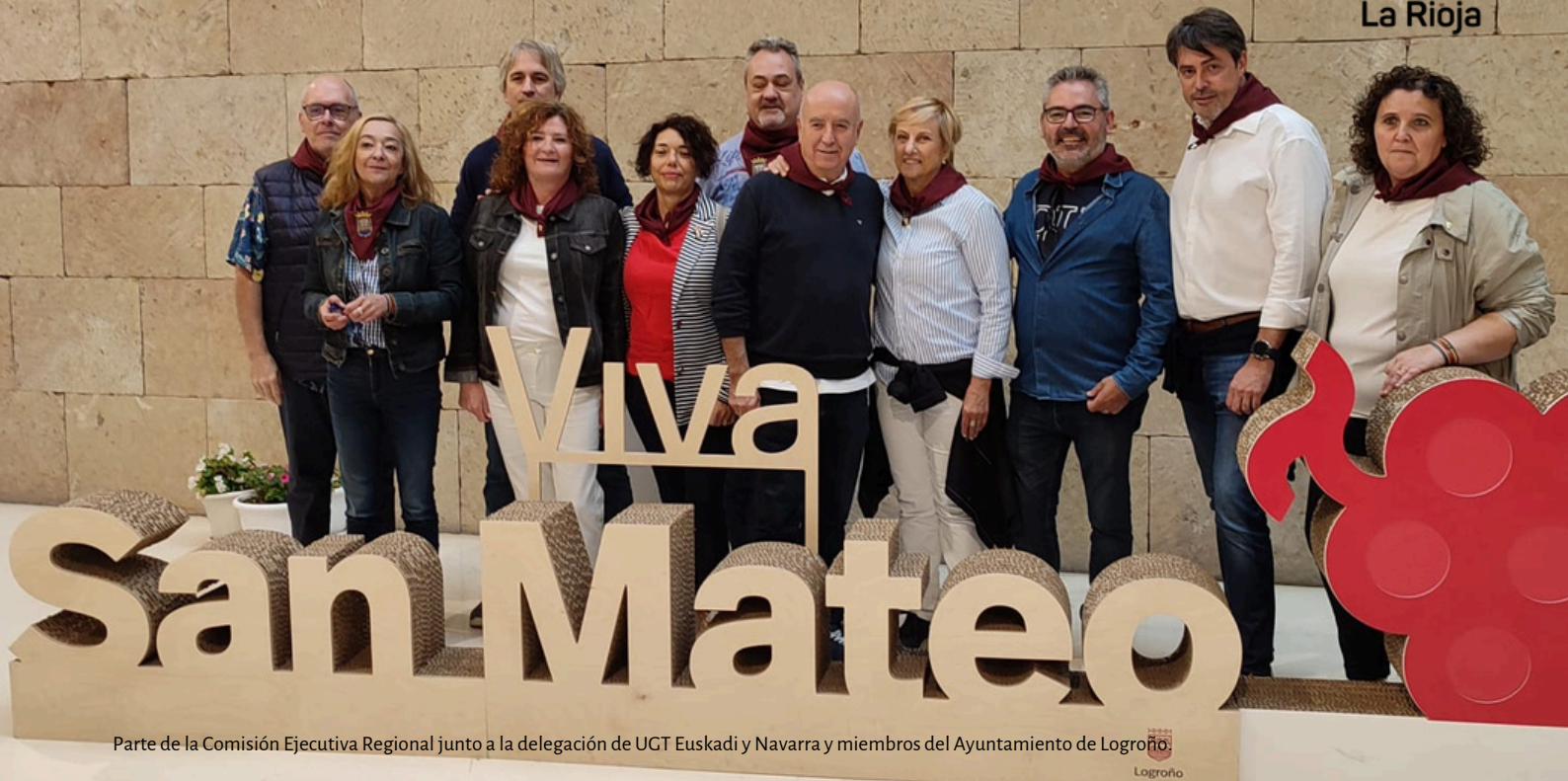
Parte de la Comisión Ejecutiva Regional junto a la delegación de UGT Euskadi y Navarra y miembros del Ayuntamiento de Logroño.