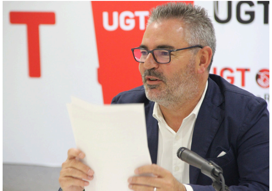
El secretario general fue desgranando, uno a uno, los temas de interés para UGT.

La mejora de los salarios continuará siendo clave en la acción sindical