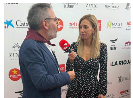
Arriba, miembros de UGT La Rioja en el Concurso de Ranchos y el acto de Exaltación de la Chuletilla Asada. Debajo, dos de las entrevistas que ofreció el secretario general de UGT La Rioja durante las fiestas de San Mateo.