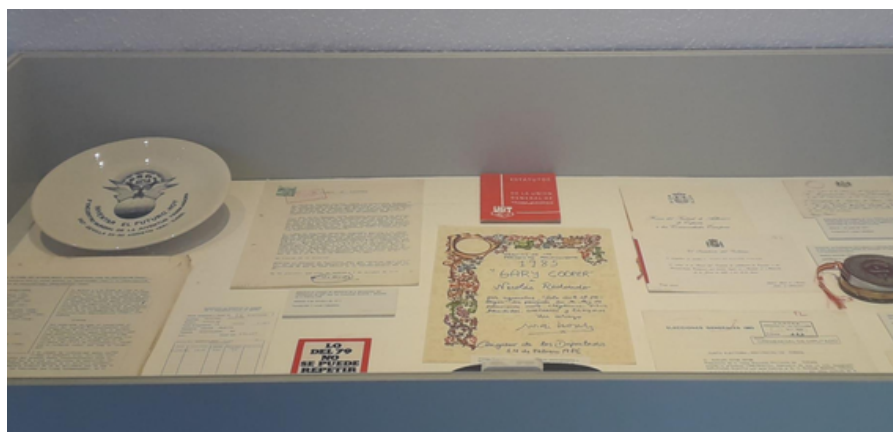
Paneles, documentos y parte de los objetos personales que podrán visitarse en la exposición.