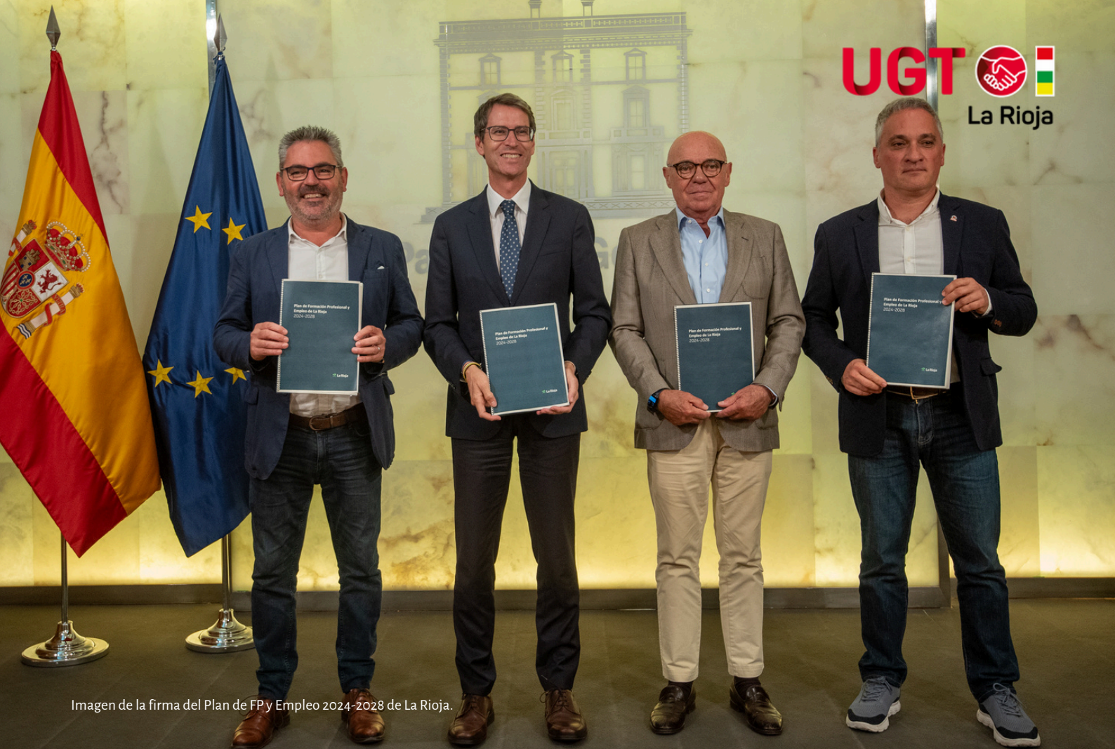
Imagen de la firma del Plan de FP y Empleo 2024-2028 de La Rioja.